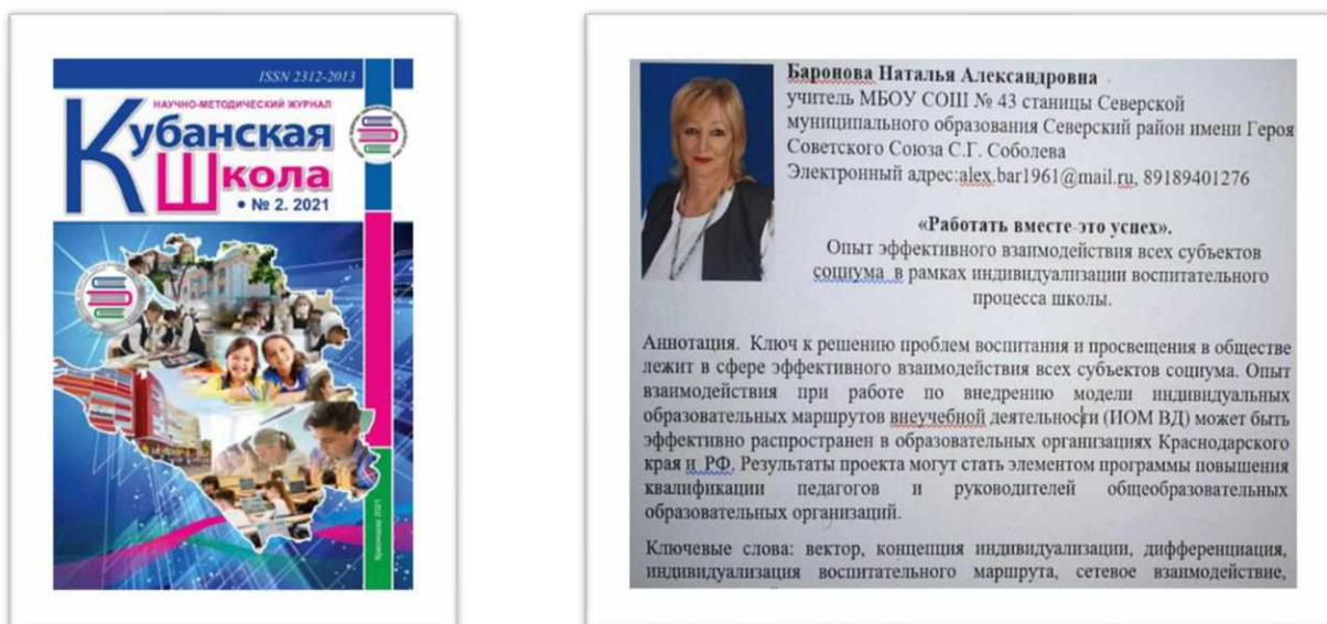
Рисунок 8. Статья Н.А. Бароновой «Работать вместе-это успех»

Набирая обороты, проект продолжил нас стимулировать. И вот сейчас мы ждём публикации Н.А. Бароновой «Работать вместе – это успех» в журнале «Кубанская школа».