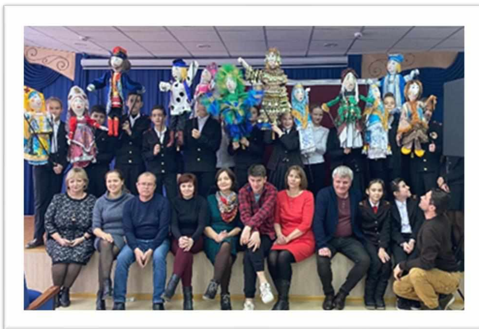
Рисунок 11. Сказка «Аленький цветочек», март 2022 года.

Реализовывая инновационный проект «Индивидуализация воспитательного процесса школы через разработку и реализацию индивидуальных образовательных маршрутов внеучебной деятельности обучающихся», наша школа еще в 2021 году подружилась с коллективом МБУК «Брюховецкого Дома культуры имени А.Г. Петрика» Брюховецкого сельского поселения Брюховецкого района. В рамках сетевого взаимодействия подписан договор. Коллектив Народного театра кукол «Арлекин» несколько раз в год приезжает к нашим ребятам со своими спектаклями.