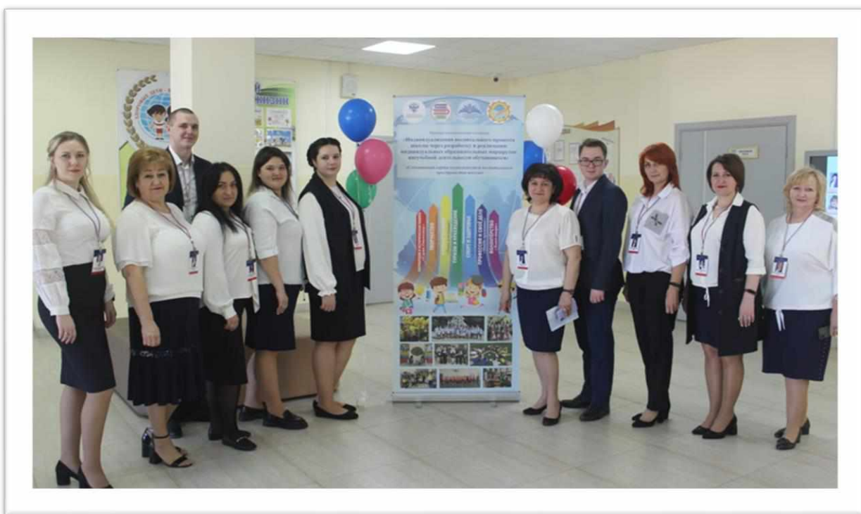
Рисунок 1. Команда КИП

«Внеурочная деятельность как возможность индивидуализации образовательной среды»