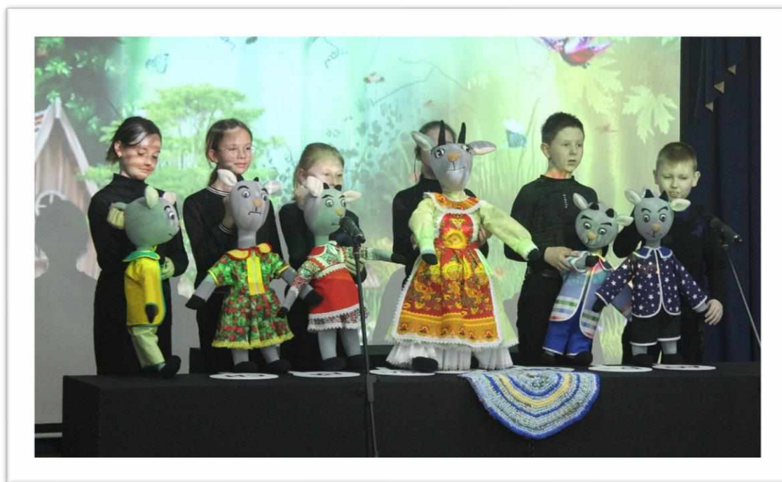
Рисунок 12. Сказка «Волк и козлята» 15.04.2023 год.

И главное, приобщаясь к великому чуду театра, каждый маленький человек начинает понимать, что он не одинок: отныне он принят в дружественную компанию единомышленников, которые живут не бытовыми ценностями, а чем-то гораздо более важным и удивительным. Не лишайте ребёнка радости общения с театром. Ребёнок развивается как личность, когда осваивает взрослый мир доступным ему образом – именно в игре.