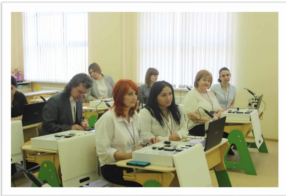
Рисунок 13. Гости стажировки в детской цифровой лаборатории.

Для удобства использования данной лаборатории предусмотрено специальное программное обеспечение KidsLab. Оно позволяет педагогу работать с детьми в группах или индивидуально, проводить демонстрацию изучаемого материала в режиме реального времени. В комплект Releon Kids также входят готовые сценарии экспериментов, но учитель может на их основе и самостоятельно формировать авторские занятия.