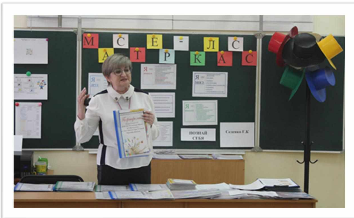
Рисунок 5. Презентация портфолио обучающихся

Полученные результаты позволяют нам сделать вывод об эффективности использования индивидуальных образовательных маршрутов.