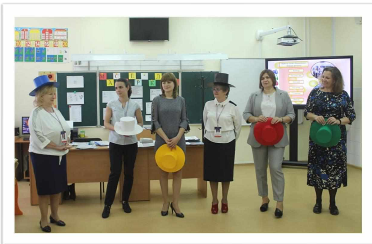
Рисунок 3. Мастер-класс

В ходе мероприятия коллектив школы представил эффективные методики работы с классным коллективом в совместной творческой и исследовательской деятельности, поделился опытом научной работы, были представлены публикации в педагогических и научных изданиях, а также предложены к ознакомлению выпущенные работниками школы учебно-методическое пособие и сборник дидактических материалов.