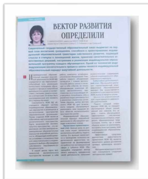
Рисунок 6. Статья Г.С. Николаенко «Вектор развития определили» в журнале «Педагогический вестник Кубани»

Работа над проектом продолжалась, следующей стала статья также Г.С. Николаенко «Индивидуальные образовательные маршруты внеучебной