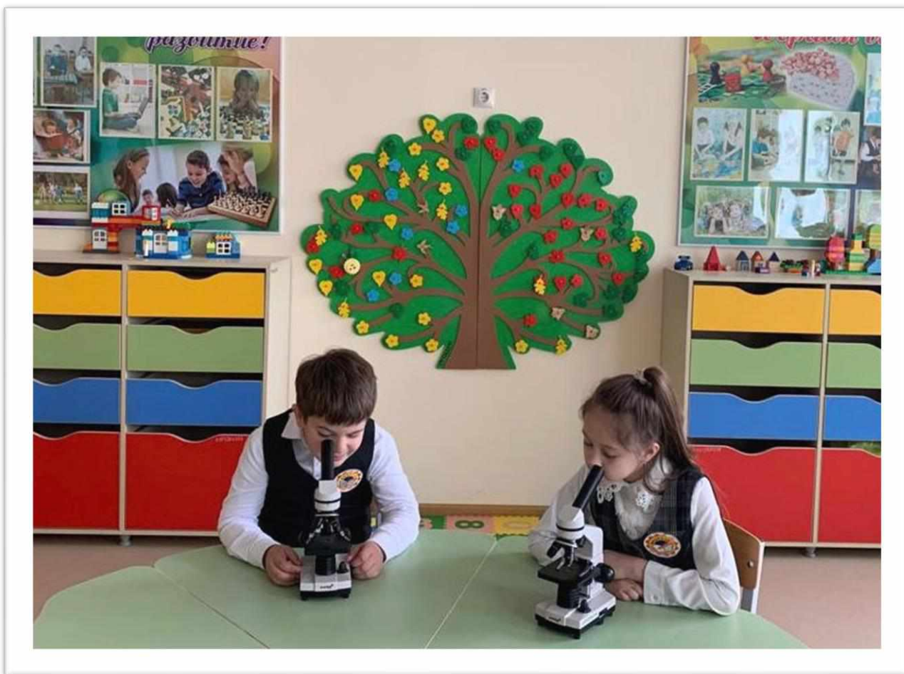
Рисунок 14. Занятия обучающихся в Kids Lab

Благодаря личной мотивации, осмысленности и практико-ориентированной деятельности школьников изучение природы превращается в увлеченный поиск истины. Также постановка опытов и наблюдения имеют большое значение для ознакомления обучающихся с сущностью экспериментального метода, с его ролью в научных исследованиях и в формировании умений самостоятельно приобретать и применять знания, развитии творческих способностей.