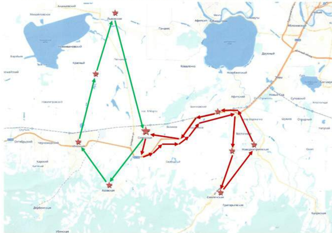
Карта-схема маршрута с указанием направления движения, ★ - остановки

Я предлагаю Вашему вниманию автобусную экскурсию по местам боевой славы Северского района с посещением памятников павшим