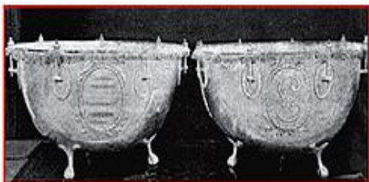
Большие серебряные литавры, переданные Войску верных казаков по повелению императрицы Екатерины II в 1788 г.